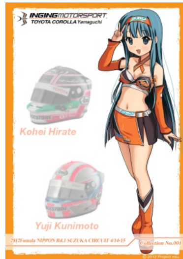
オートグラフカード