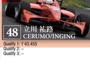
48 立川 祐路 CERUMO/INGING

Quality 1: 1'43.455 Quality 2: - Quality 3: -