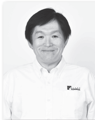
オフィシャルコメンテーター 小倉 茂徳

1998年、2001年、2003年、2005年と、4度のチャンピオンを獲得。また、最多ポールポジション獲得など、さまざまな記録を持つ、日本を代表するトップドライバー。2014年シーズンでは、JRP主催のトークショーに出演した他、場内実況解説やテレビ解説も担当。そんな本山哲氏が、2015年は「アンバサダー」としてスーパーフォーミュラのプロモーションの中心で活躍します。