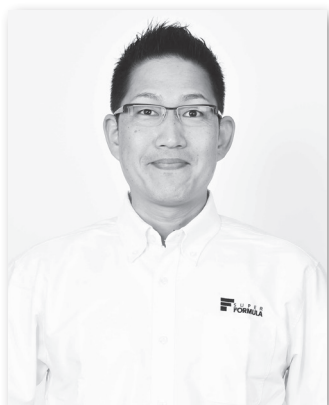
オフィシャルコメンテーター ピエール 北川

1987年からの2年間、ホンダF1チームの広報担当といった経歴を持ち、現在はモータースポーツジャーナリストとしてモータースポーツ関連記事の執筆を手掛け、フジテレビF1中継の解説やラジオ等にも出演。スーパーフォーミュラをこよなく愛し、子どもたちへスーパーフォーミュラの面白さを伝えるため、全国各地のサーキットを転戦。現場ではドライバー、エンジニアへの取材やトークショー、解体ショーなどに出演。また、スマイルキッズイベントでは、小学校訪問の授業進行や解説等、サーキット以外でのプロモーション活動に積極的に参加している。