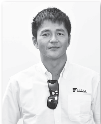
アンバサダー 本山 哲

1998年、2001年、2003年、2005年と、4度のチャンピオンを獲得。また、最多ポールポジション獲得など、さまざまな記録を持つ、日本を代表するトップドライバー。2014年シーズンでは、JRP主催のトークショーに出演した他、場内実況解説やテレビ解説も担当。そんな本山哲氏が、2015年は「アンバサダー」としてスーパーフォーミュラのプロモーションの中心で活躍します。