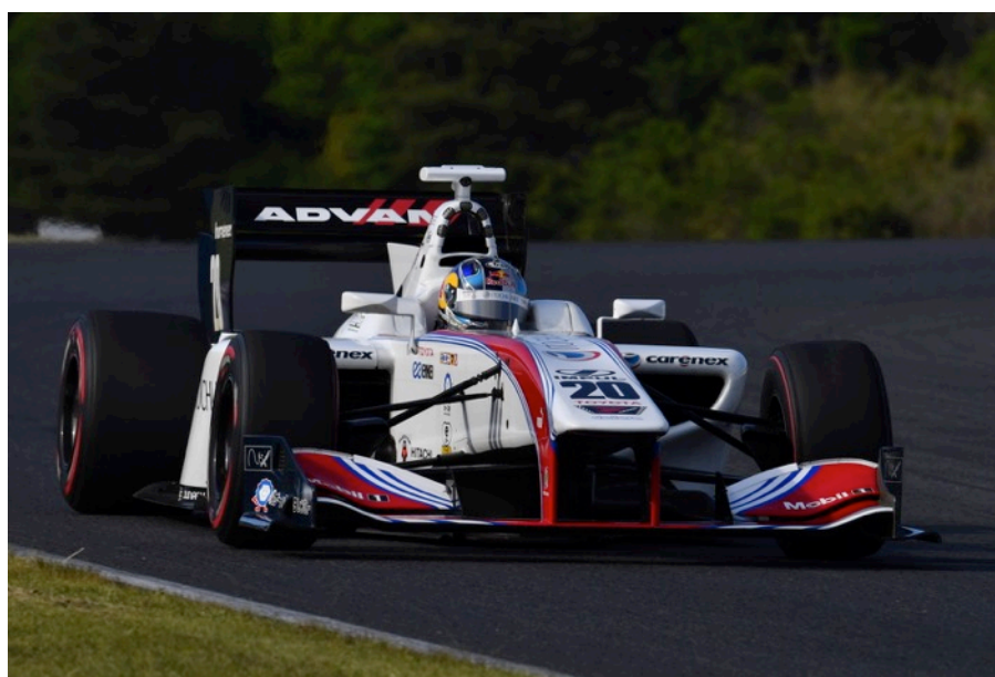
ポールポジションを獲得した平川 亮(イトウチュウエネクス チーム インパル)