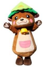
<くまモン（熊本県）とおぐたん（小国町）>