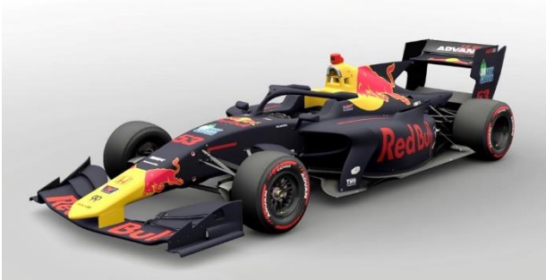
Red Bull TEAM GOH G01 SF19